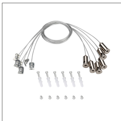
037005 Набор SPX-T6 для панелей 1200