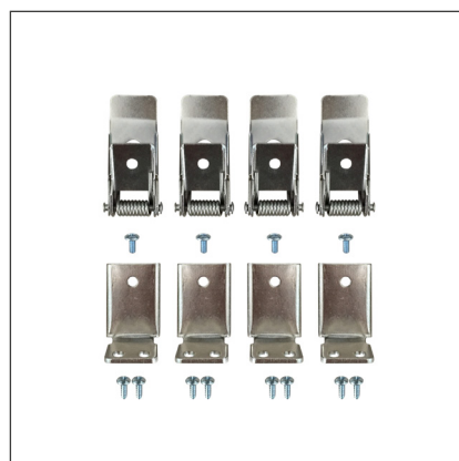
037006 Набор FX-T4 для панелей 300, 600