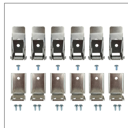
037007 Набор FX-T6 для панелей 1200