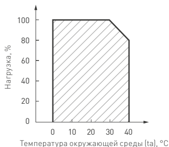
Рис. 2. Максимальная допустимая нагрузка, % от мощности источника.