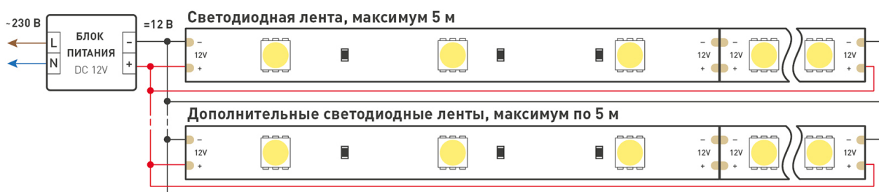
Схема 2. Подключение нескольких светодиодных лент с двух сторон.

Рекомендуется использовать для обеспечения равномерного свечения ленты по всей длине.