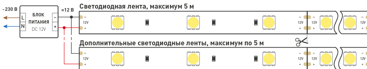
Схема 1. Подключение нескольких светодиодных лент с одной стороны.

Максимальная длина подключения ленты – 5 м (1 катушка).